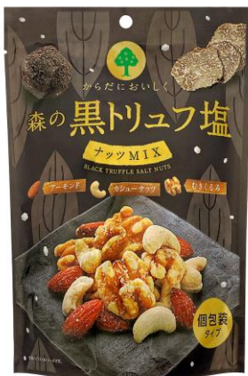
『森の黒トリュフ塩ナッツミックス』

当社の『森の黒トリュフ塩ナッツミックス』は、黒トリュフの豊かな香りとナッツの旨味が楽しめる贅沢なおつまみナッツです。発売以来、累計出荷数は530万袋を突破し、当社売上No.1の商品として愛され続けています。（当社調べによる2017年2月～2025年1月までの累計出荷数）