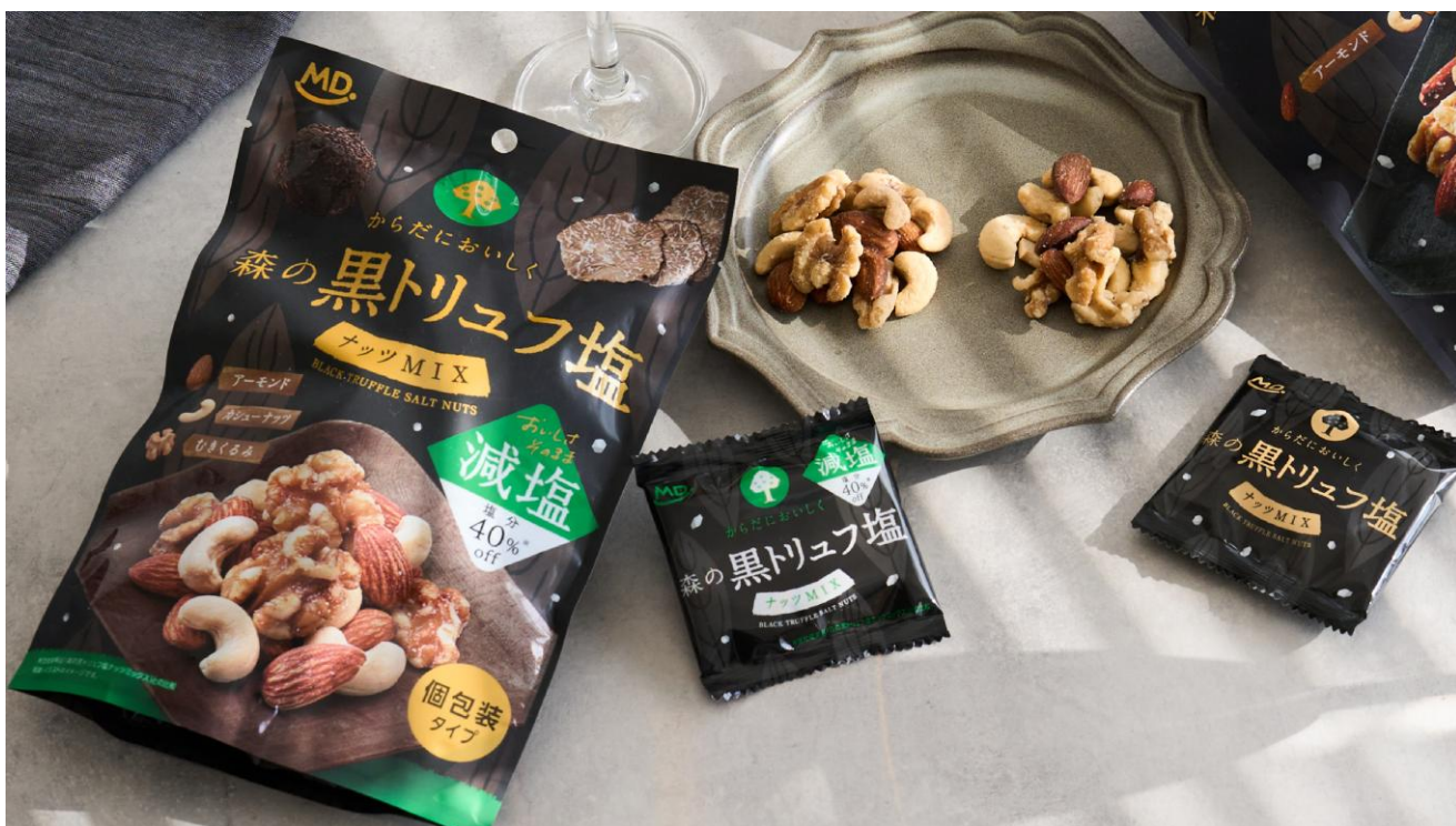
『森の黒トリュフ塩ナッツミックス 減塩』

株式会社MDホールディングス（本社：大阪府東大阪市）は、発売から累計出荷数530万袋を突破した『森の黒トリュフ塩ナッツミックス』の姉妹品として、従来品から塩分を40%カットした『森の黒トリュフ塩ナッツミックス 減塩』を、2025年3月3日（月）より、全国で発売いたします。