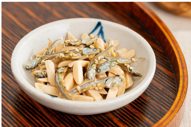
減塩小魚&アーモンド

本商品は、塩分を70%カットした国産のいりこに、アーモンドとクルミをそれぞれミックスした健康応援お菓子です。新鮮な国産の片口いわしを浜買いして、煮干しにする際に真水で仕上げた減塩いりこを使用。特別に配合した糖蜜を使用することで素材の旨みを引き立たせるあまじょっぱい味わいに仕上げている、高い満足感を実現しました。