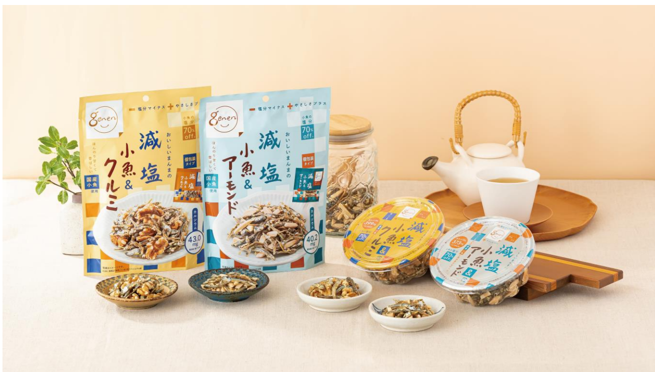
（左から）『減塩小魚&クルミ』『減塩小魚&アーモンド』『減塩小魚&クルミ カップ』『減塩小魚&アーモンド カップ』

株式会社MDホールディングス（本社：大阪府東大阪市）は、塩分を70%カットした国産いりこを使用した『減塩小魚&アーモンド』『減塩小魚&クルミ』『減塩小魚&アーモンド カップ』『減塩小魚&クルミ カップ』を、2024年9月2日（月）より、全国で発売いたします。