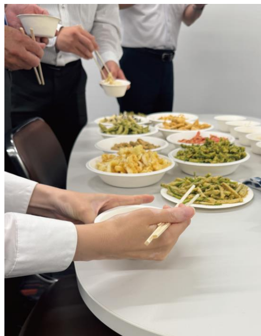
社内で実施した、そうめんや天ぷらのお菓子の食べ合わせを楽しむ試食イベントの様子