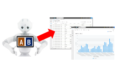
利用例 1：アンケート