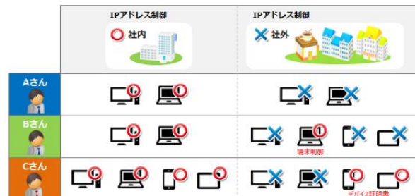
特徴 2： アクセス制御ポリシー

SBT は今後も、本サービスの提供を通じ、“セキュリティの担保”と“利便性の確保”の両立によるクラウドサービスの利便性向上を支援してまいります。