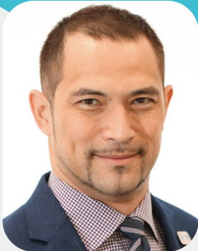
室伏 広治 氏

2004年アテネ五輪金メダル・ 2012年ロンドン五輪銅メダル ハンマー投げ日本代表 /スポーツ庁長官