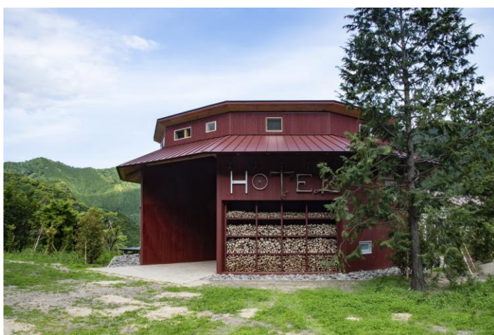
Transit General Office Inc.

着用開始に先立ち2023年7月24日、川村通商が運営するワークショップを開催。ホテルスタッフ自ら、自身が着用するフットウェアを作成しました。