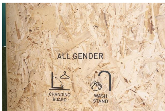
各ブースの扉には プラスαの機能を表示