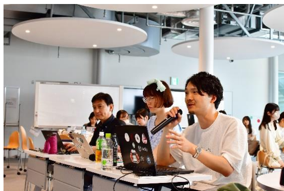
発表時には3名の審査員からの 質疑応答も行われました