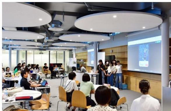
成果発表プレゼンテーションの様子

日本女子大学（東京都文京区、学長：篠原聡子）は、女子大学6校が連携する「女子大学生ICT駆動ソーシャルイノベーションコンソーシアム（呼称：WUSIC※1）」とともに8月18日（金）、19日（土）、20日（日）の3日間にかけて、3D都市モデル「PLATEAU※2」を活用して、地域課題の解決や将来のスマートシティ・都市DXに必須となる最先端の都市ビジュアライゼーションを学び、アイデアを出し合うアイデアソンイベント「Project PLATEAU ブートキャンプ for Women's University Students 2023」を開催しました。