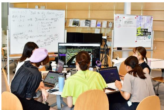
Figmaなどのツールを駆使し 限られた時間の中でアイデアをまとめる

3D 都市モデルに触れ、自身の研究や将来のビジネスでのデータ活用に生かしてもらおうためのスキルを身につけ、必要な情報をモデルと合わせて、他者に可視化しながら協働し、課題解決を提案する力を高めていきます。