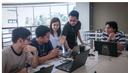
フィリピン大学ディリマン校の様子

フィリピン大学の中心校の1つであるディリマン校は、芸術・文学、社会科学・法律、経営・経済、科学・技術の各研究を行っています。また、国内に全部で10あるキャンパスの中で4番目に長い歴史を持ち、学位授与数、学生数、教員数、図書館資料数において、同大学内で最大数を誇ります。