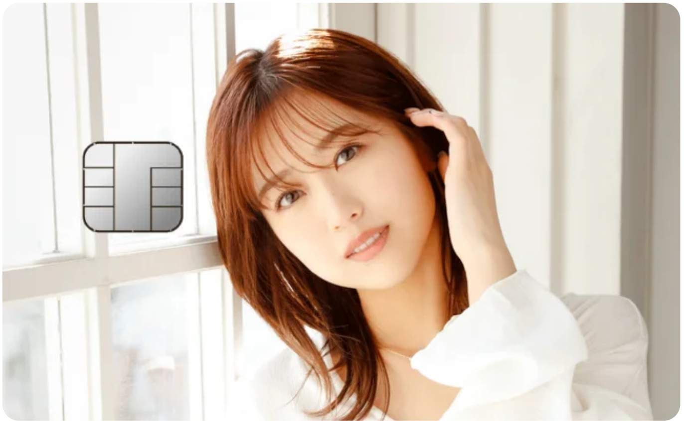
オリジナルデザインカード