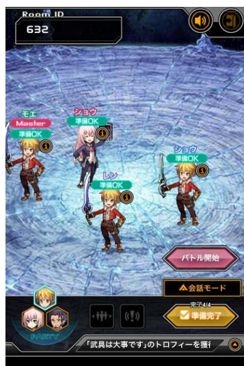
ルームで バトル前の準備を