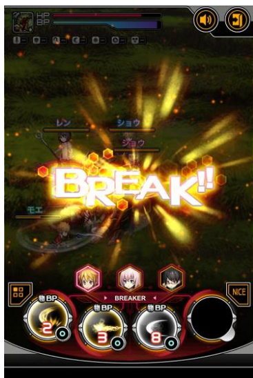
敵をブレイクすると 大ダメージのチャンス！