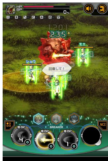
ロールの分担と連携が 勝利のカギ！