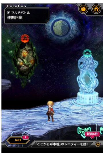
時幻の狭間から マルチバトルに挑戦

ルーム画面およびマルチバトル中は、テキストチャットや汎用セリフ(定型文)を使って、プレイヤー同士でコミュニケーションを取ることができます。