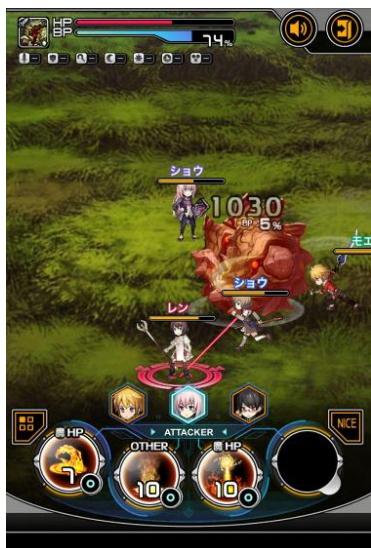
戦場を自由に動き回る アクションコマンドバトル

マルチバトルのボスなど、特定の敵には「BP」が設定されており、これを100%にすることで敵を「ブレイク」することができます。ブレイク状態の敵は行動不能になるほか、ブレイク中はアビリティも短い間隔で使用できるので、敵に大ダメージを与えるチャンスとなります。