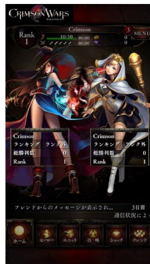
ランクマッチバトル

バトルは、今後のアップデートにより、任意のフレンドといつでも対戦できるフリーマッチ、制限時間内により多くの敵を倒すタイムアタックなど、さまざまなモードを順次追加してまいります。