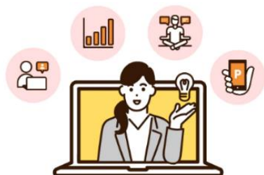
ウェルネスストア

麒麟ビレッジでは、企業の健康経営トータル支援サービスとして、「KIRIN naturals」を展開しています。「KIRIN naturals」は、動画・eラーニング・サーベイなどの多彩な機能と分析支援で、施策立案から効果検証が可能な「ウェルネスストア」と、従業員の健康的な食習慣をサポートする、飲料や食品の置き型サービスの「ウェルネススタンド」の2プランを展開し、企業の課題に合わせて、最適なソリューションを提案しています。「ウェルネスストア」は、企業からの多数の要望を反映させ、2022年12月に大幅にコンテンツ内容を刷新しました。2017年1月より展開を始めて、2024年3月末時点では546拠点に導入されています。今後もお客様のニーズに対応するためコンテンツの充実に取り組み、企業の健康経営のサポートを行ってまいります。