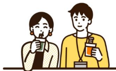
ウェルネススタンド

・「KIRIN naturals」に関する Web サイト（企業向け）： https://k-naturals.jp/