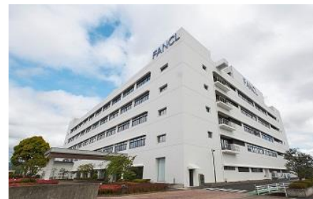
ファンケル美健 三島工場（外観）

キリングroup°は長期経営構想「キリングroup°ビジョン 2027（以下 KV2027）」を策定し、「食から医にわたる領域で価値を創造し、世界の CSV ※ 先進企業になる」ことを目指しています。その実現に向けて、既存事業の「食領域」（酒類・飲料事業）と「医領域」（医薬事業）に加え、キリングroup°が長年培ってきた高度な「発酵・バイオ」の技術をベースにして、人々の健康に貢献する「ヘルスサイエンス領域」（ヘルスサイエンス事業）の立ち上げ、育成を進めています。