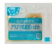
プラズマ乳酸菌入りたれ