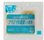
プラズマ乳酸菌入りたれ