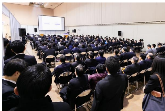
2019年1月開催「北海道IRショーケース」 基調講演の様子