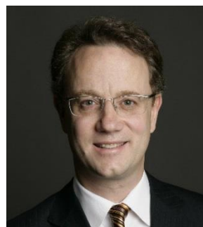
ラスベガス・サンズ グローバル開発 マネージング・ダイレクター マリーナバイサンズ 代表執行役 兼 CEO