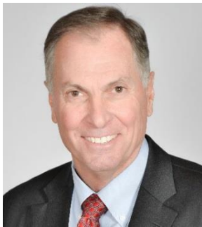
シーザーズ ・エンターテインメント 国際開発 社長