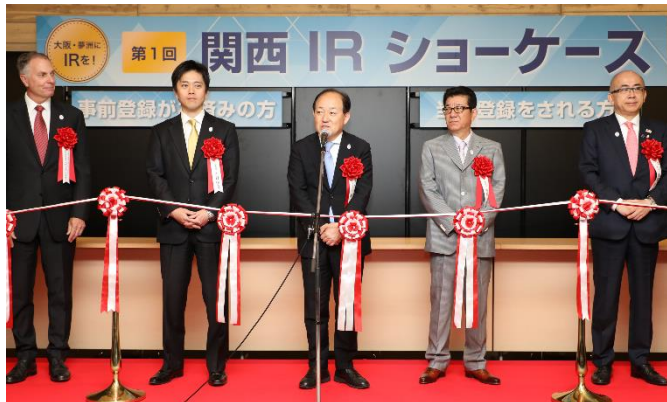
2018年4月27日「第1回 関西 IR ショーケース」開会式