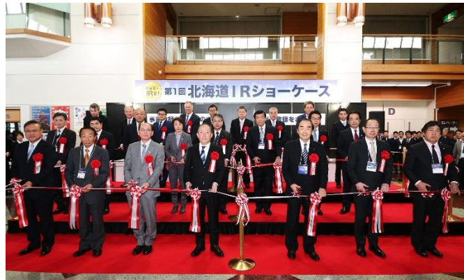
2019年1月9日「第1回 北海道 IR ショーケース」 オープニングセレモニー