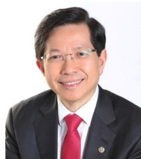
ゲンティン・シンガポール 代表取締役社長