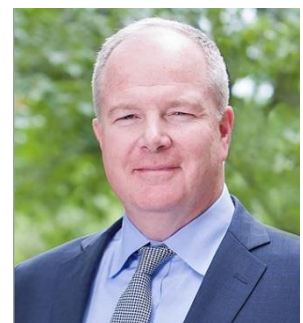
ウィン・リゾート ディベロップメント ジャパン 代表