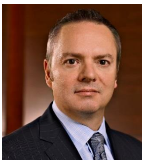
日本 MGM リゾート 代表執行役員 兼 CEO