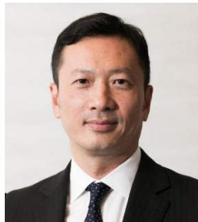
ギャラクシー ・エンターテインメント 最高執行責任者