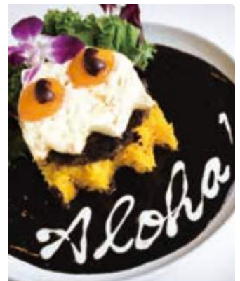
GHOST LOCO-MOCO $ 16.95