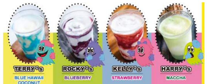
TEAM-GHOST FROZEN DRINK $ 5