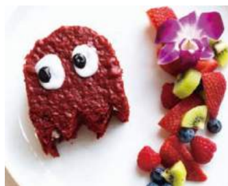
GHOST VELVET CAKE $ 9.50