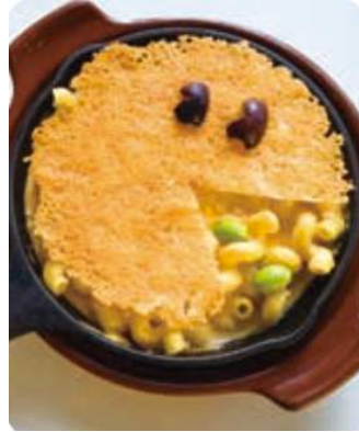
PAC-MAN MAC'N CHEESE $ 9.95