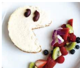
PAC-MAN CHEESE CAKE $ 13.95