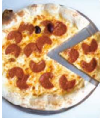
PAC-MAN PEPPERONI PIZZA $ 13.95