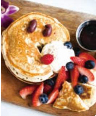
PAC-MAN PANCAKE $ 10.95

「PAC-STORE HAWAII」でしか食べられない フォトジェニックな期間限定オリジナルコラボレーションメニュー全15種類！！ ぜひこの機会にお楽しみ下さい。