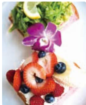
PAC-MAN FRUITS SANDWICH $ 14.95