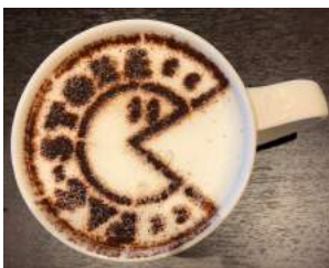
PAC-STORE CAFFE LATTE $ 5