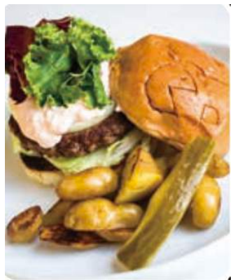
PAC-MAN BURGER $ 15.95