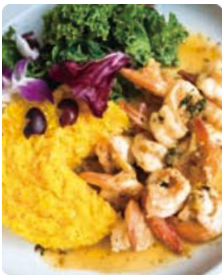
PAC-MAN GARLIC SHRIMP $ 16.95