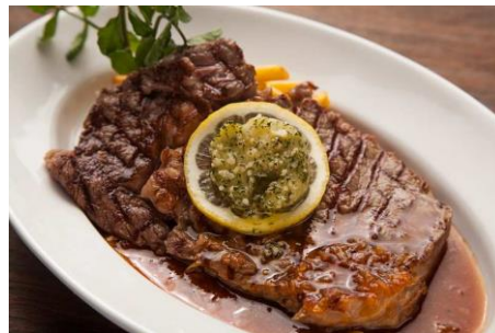
US リブアイロースグリル 淡路島玉ねぎソース