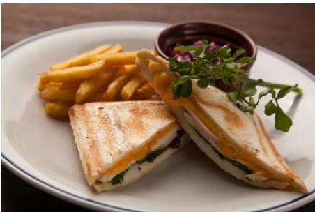
ターキーと大葉のチーズホットサンド