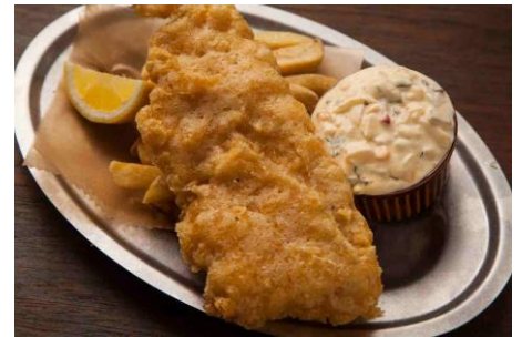
真鱈のフィッシュ&チップス