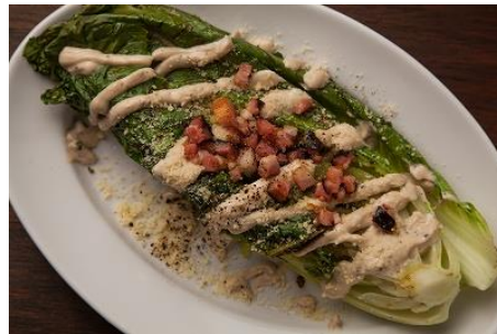
長野県産ロメインレタスと黒胡椒の グリルドシーザーサラダ