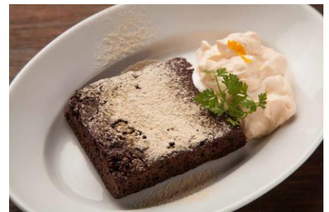
和三盆の濃厚ガトーショコラ 完熟みかんクリーム