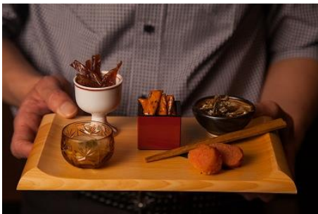
TASTE OF “JAPAN” 日本の珍味 5 種を盛り合わせた逸品