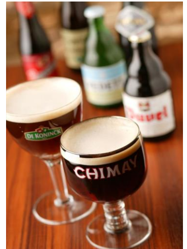
※ドリンク写真はイメージです