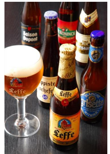
※ドリンク写真はイメージです