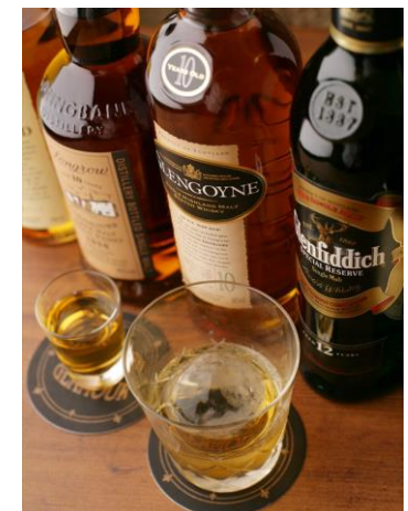
※ドリンク写真はイメージです