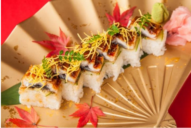
【お寿司】うなぎ押し寿司！ 1,180円

直虎が治めた国、遠江・井伊谷(現・静岡県 浜松市)は、うなぎの養殖発祥の地としても有名です。脂のよくのったうなぎに甘辛いタレを絡めた、贅沢な味わいの押し寿司をご用意いたしました。当店の「押し」メニューです！