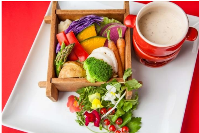
【お野菜】豪華絢爛 赤々と咲き誇るばーにゃかうだー 1,480円

うなぎと並ぶ浜松のご当地グルメ「浜松餃子」を戦国武勇伝風アレンジ！付け合わせのもやしやシャキシャキした食感がアクセントになり、飽きずにお召し上がり頂けます。お好みで自家製の『赤備え“食べるラー油”』を付けてピリ辛にしてもOK！