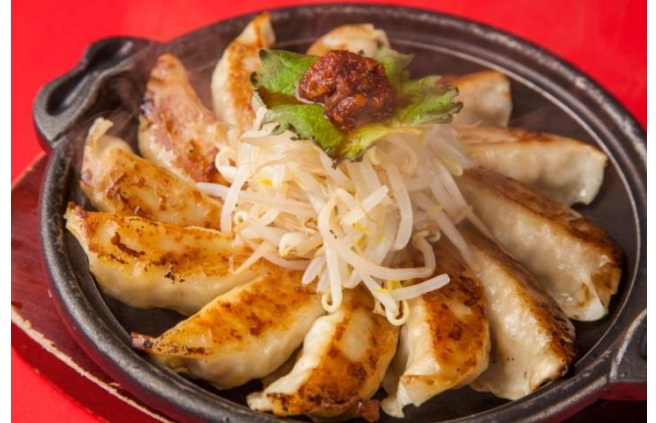
【餃子】銅丸南蛮甲冑鋼鐵 浜松餃子 980円

直虎が治めた国、遠江・井伊谷(現・静岡県 浜松市)は、うなぎの養殖発祥の地としても有名です。脂のよくのったうなぎに甘辛いタレを絡めた、贅沢な味わいの押し寿司をご用意いたしました。当店の「押し」メニューです！