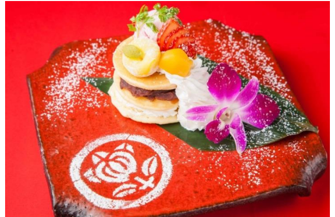
【甘味】桜っ。直どら焼き 950円

旗印である「井桁紋」を模した器の中に、カラフルでフォトジェニックなお野菜を盛り付けました。バーニャカウダソースをたっぷりつけてお召し上がり下さい。