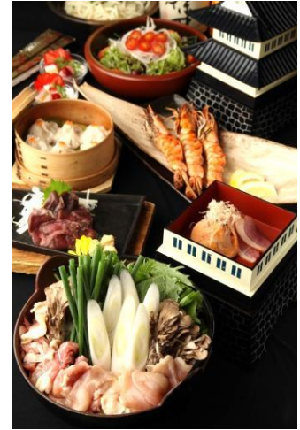
※お写真はイメージです