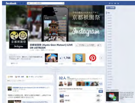
京都祇園祭 Facebook ページ

悠久の歴史を持つ祇園祭を、最新のネットテクノロジー「マイクロビデオサービス」を通じて世界に配信