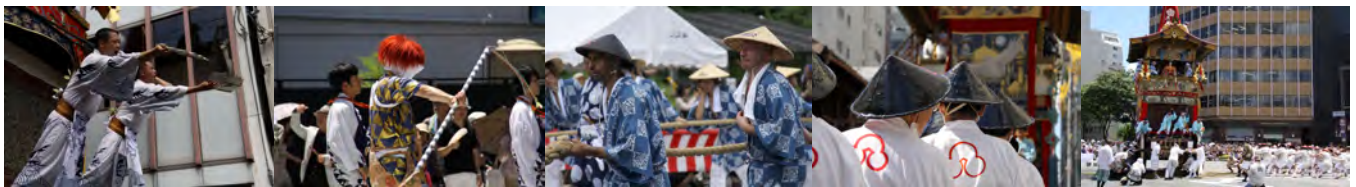
※これらの画像は 2012 年のもの