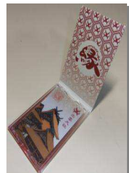
【カードケースに封入時】

※「楽天Edyカード（ラクテンエディ）」は、楽天グループのプリペイド型電子マネーサービスです。