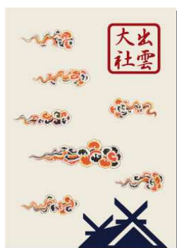
【専用カードケース】