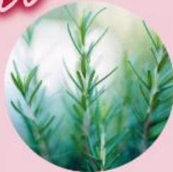
ローズマリー エキス