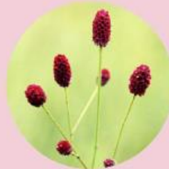
ワレモコウ エキス