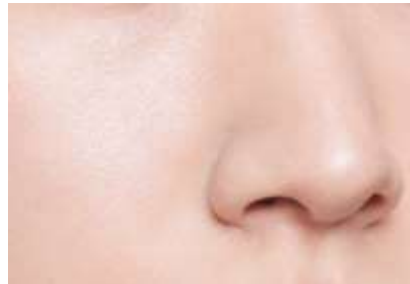
仕上がりイメージ 01 ライト