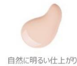
自然に明るい仕上がり