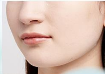
仕上がりイメージ