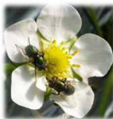
ビーフライの訪花