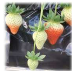
ビーフライの交配 で結実した果実

花粉媒介昆虫としてのヒロズキンバエ（商品名：ビーフライ）を利用したイチゴの促成栽培の例。イチゴ以外にマンゴーなどでも利用できる利点がある