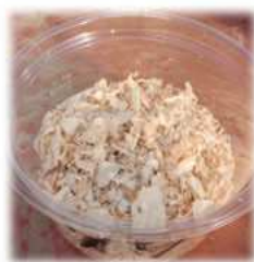
カンナ屑に混ぜた ビーフライの蛹

マゴットセラピーやビーフライに用いられるヒロズキンバエ。マゴットセラピーにはヒロズキンバエの幼虫（マゴット）を使用するがジャパンマゴットカンパニーの技術で無菌である