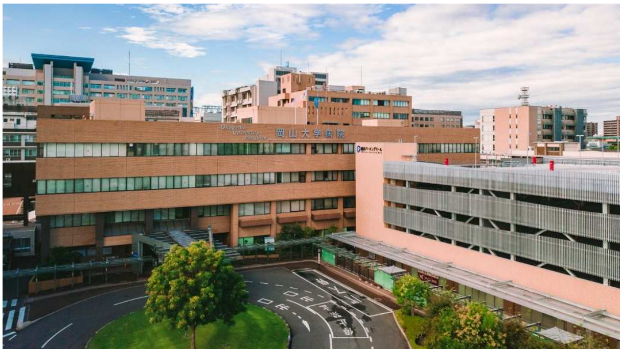
岡山大学病院（岡山市北区）

国立大学法人岡山大学は、国連の「持続可能な開発目標（SDGs）」を支援しています。また、政府の第1回「ジャパン SDGs アワード」特別賞を受賞しています