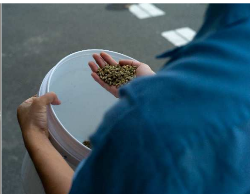
リジェネラティブ・オーガニック農法による コーヒー生豆