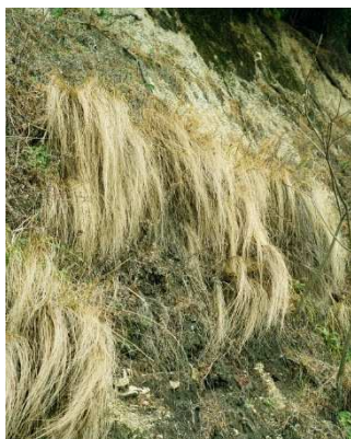
土壌の健康面が解決策

：生産地域のテロワールをコーヒーに反映させるよう、素材の特徴が生きるシンプルな焙煎を心がけています。