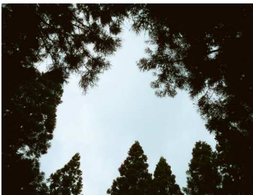
環境に優しいシェードグロウン(日陰栽培)