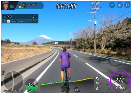
実写コースイメージ

実写と3Dによる仮想空間の両方の映像に対応しています。実写・3D空間のどちらのコースでも3DCGでモデリングした自身のアバターが走るため、他のユーザーとの並走やレースを楽しむことが可能です。また、中国語や英語のほか、日本語に対応しているのも特長です。