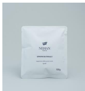
NEHAN TOKYO Epsom salt <400g> / 500円（税抜）

精油を垂らしてUSBポートに差し込むだけで、パーソナルスペースに柔らかくかおりを広げるモバイルディフューザー