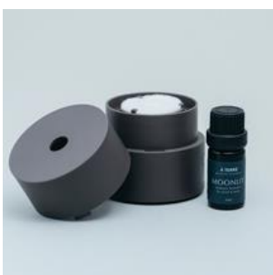
@aroma Aroma Fun Diffuser 「ko」 / 3,000円（税抜）

ポータブルなので、あらゆる空間で手軽にアロマライフをお楽しみ頂けます。旅行や出張にも。