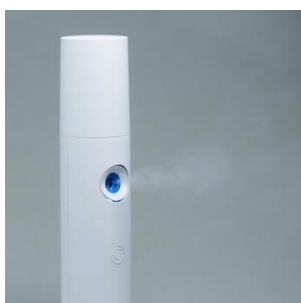
ARTQ ORGANICS Portable Aroma Diffuser / 11,500円（税抜）

STEP1 → スプレーヘッドを開けて、好みの精油を10滴ほど入れる STEP2 → スプレーヘッドをボトルに戻し、しっかり締めて、よく振ったら完成 ※ボトルに貼るフリーラベルを同封。ブレンドレシピ・制作日の記録や手作りリストのメッセージラベルとしてお使いください。プレゼントにも最適です。