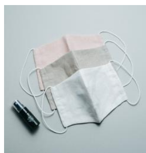
yoggy sanctuary AROMASK/ 3,300円（税抜）

マスクがスタイリングの一部となった今。浅くなる呼吸やマスク内の蒸れを解消するアロマミストと共に。マスクはオーガニックコットン&リネンで肌に優しく。