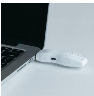
@aroma USB aroma time / 1,800円（税抜）

精油を差し込んでエアコンの吹き出し口に取り付けだけで、自然なかおりを柔らかく広げる車用アロマディフューザー