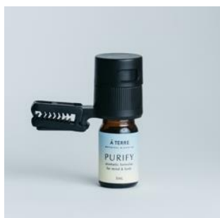
@aroma car diffuser Drive time clip / 2,700円（税抜）

マスクがスタイリングの一部となった今。浅くなる呼吸やマスク内の蒸れを解消するアロマミストと共に。マスクはオーガニックコットン&リネンで肌に優しく。