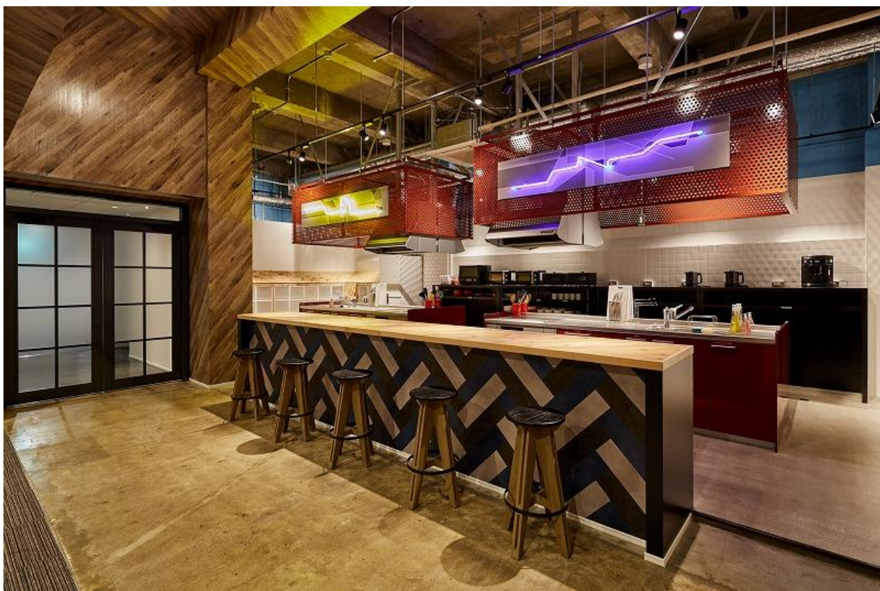
<1F キッチンスペース>