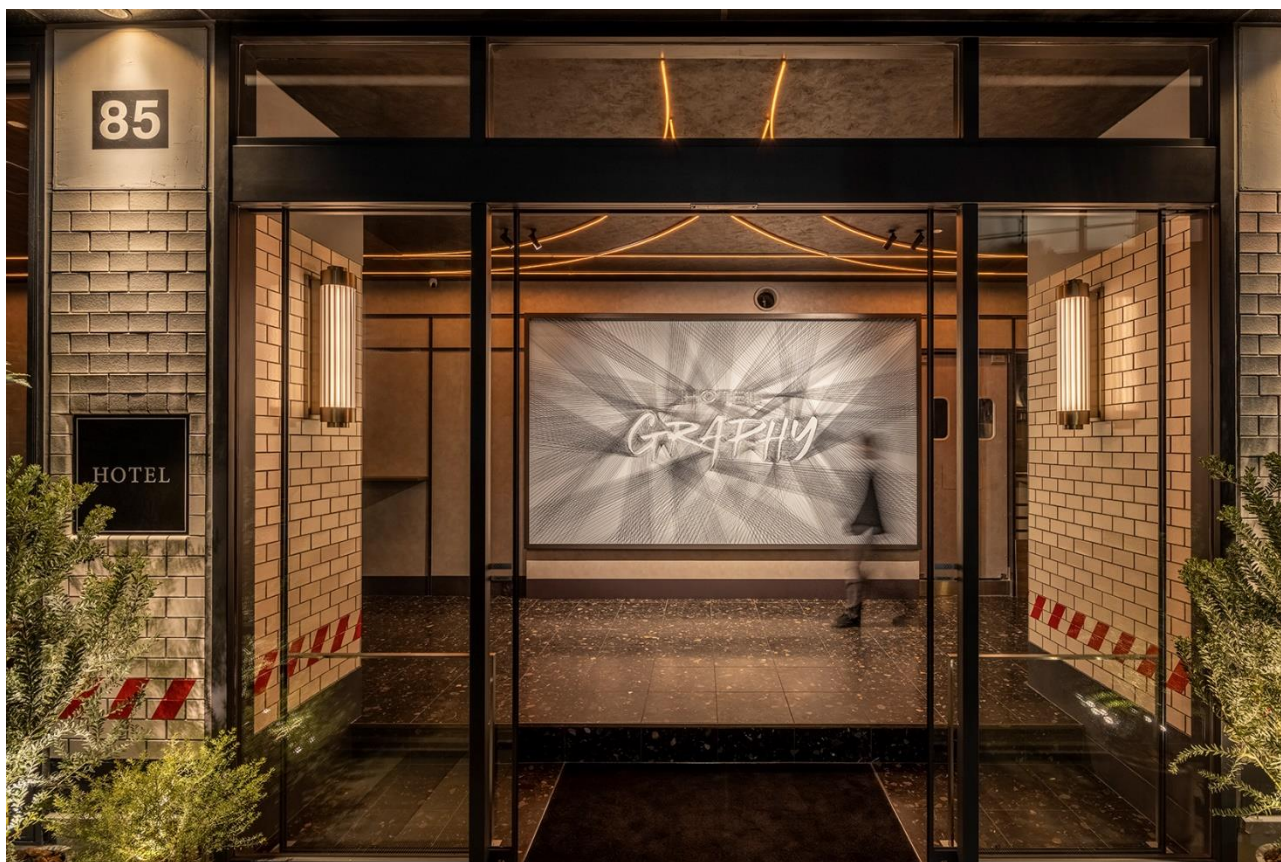
(画像：フラワーアートの展示場所となるホテルエントランス)