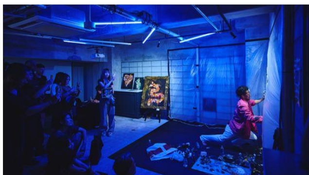
(画像：昨夏初開催の LIVELY FES2024)

ライフスタイルホテル「THE LIVELY 大阪本町」が主催する音楽とアートをテーマにした屋内フェス「LIVELY FES」は、昨夏、開業5周年記念イベントとして初開催されました。「関西の今を体験できるフェス」をテーマに掲げ、ライフスタイルホテルならではの非日常的な空間で関西で活躍するアーティストによるパフォーマンスを楽しめる場として、多くの方にご来場いただきました。そして、皆さまからのご好評を受け、今年の締めくくりとなるカウントダウンイベントとして「LIVELY FES」第2弾の開催が決定。世界3大パーティーの「フルムーンパーティー」をオリジナルアレンジし、10名のDJと3名のアーティストによる、ジャンルレスの音楽とネオンカラーを活かしたライブペインティングで大晦日を盛り上げます。その他、フェス気分を満喫できるバケツカクテルなどのドリンクやタイの屋台フード、参加型アクティビティもご用意しております。新しい年を迎える特別な夜、ライフスタイルホテルで過ごす「自由で驚きと発見に満ちた」新しいフェスを体験してみませんか？