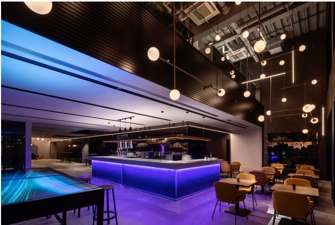
(画像：イベント会場となる1階)

タイムテーブルなど詳細・最新情報は特設サイトをご確認ください。 https://www.livelyfes.com/