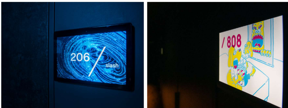
画像左:通常のルームサイネージ 画像右:アーティストコラボのサイネージ

デジタルツールを使ったホテル内に仕掛けられた様々な「デジタルアート」の一つであるルームナンバーサイネージ。通常はデジタルアートを中心に表示されるルームナンバーサイネージを、2024年8月からアーティストコラボ作品で展開しております。3名のアーティストがシーズンごとに異なるテーマで描いたアートをご宿泊滞在中にもお楽しみいただけます。