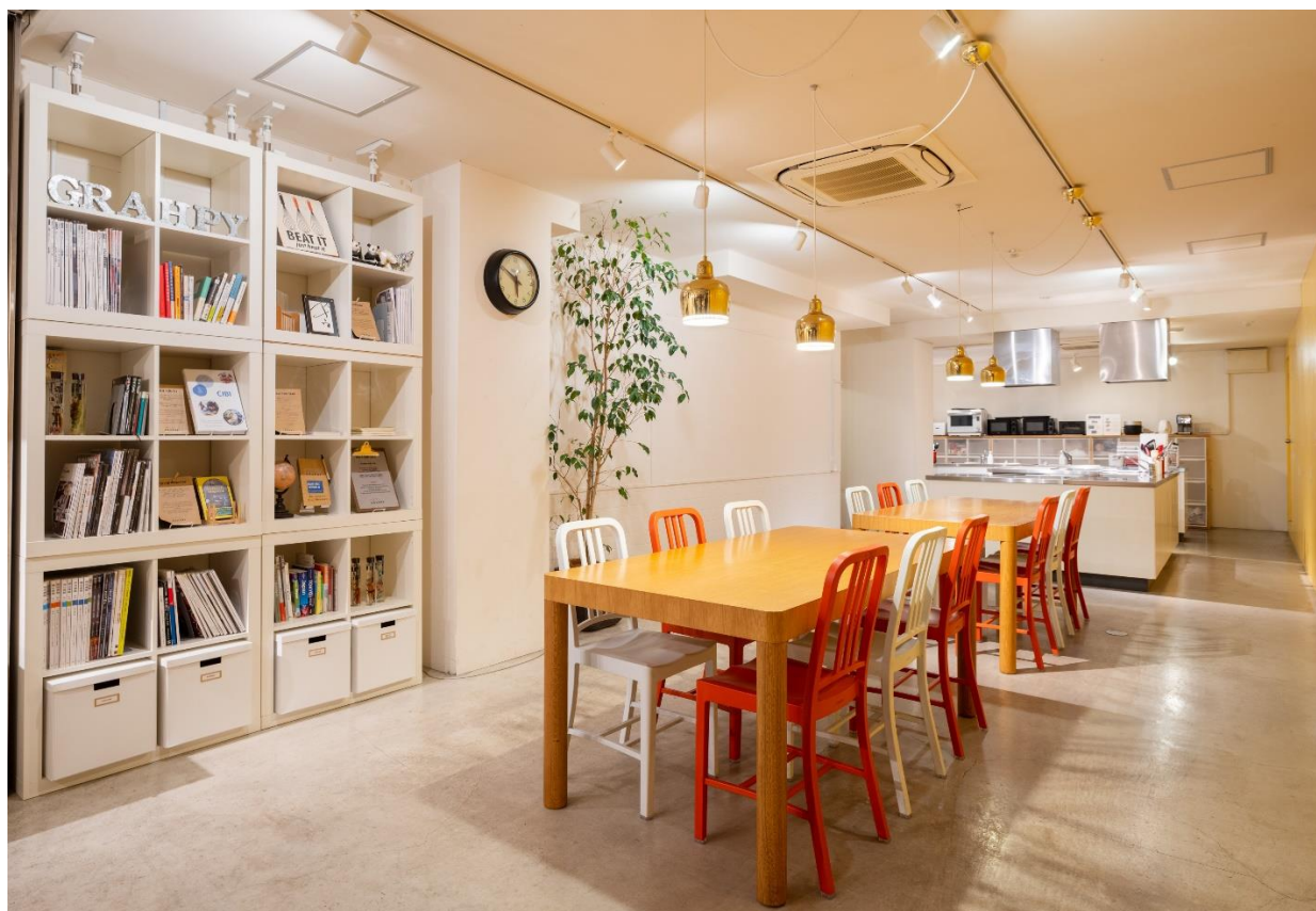
(写真：HOTEL GRAPHY 根津 ラウンジ)

近隣の皆様と共に地域に根ざした運営を目指し、街の飲食店や雑貨店、本屋など多くの皆様と繋がりを持ちながら、お互いに協力してエリアの魅力を発信することに努めてきました。2019年の一箱古本市開催時にも会場に選ばれ、多くの方に足を運んでいただきましたが、今年もイベント復活のタイミングでこうして地域を代表する一大イベントの会場として皆様にお集まりいただける機会となります。当日は、ホテルの特徴のひとつでもある共用部のラウンジやルーフトップテラスを開放、カフェでも飲み物やお食事をご用意し、宿泊せずともお気軽にホテルの空間をお楽しみいただけます。お気に入りの本を片手に、ラウンジやカフェで寛ぐのはもちろん、ホテル周辺を散策しながら谷根千エリアの魅力を存分に味わいませんか。