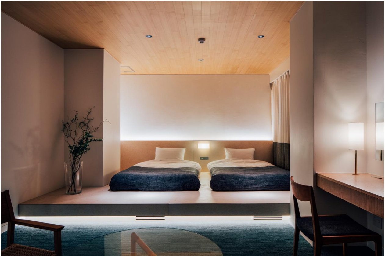
(画像・HOTEL GRAPHY 根津 客室)

Instagram : https://www.instagram.com/greenspoonjp/