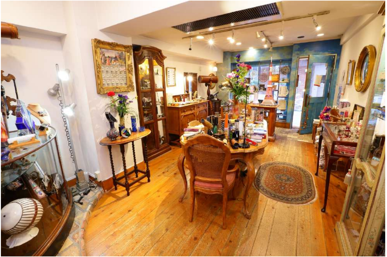
画像上：万華鏡専門店カレイドスコープ昔館／画像下：THE LIVELY 東京麻布十番 2 階フロントサイネージ投影例