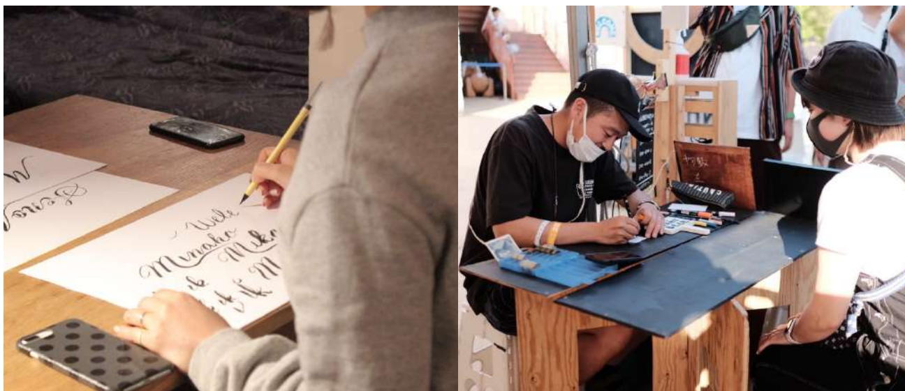
画像：左、筆ペンワークショップ／右、1分間タイムアタック似顔絵