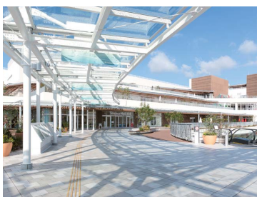
テラスモール湘南 (神奈川県藤沢市)

2011年に開業したテラスモール湘南は「豊かで落ち着いた上質な毎日」をコンセプトに、280店舗で構成する年商540億円(2015年度)のリージョナル・ショッピングセンターです。