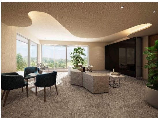
プライベートラウンジ