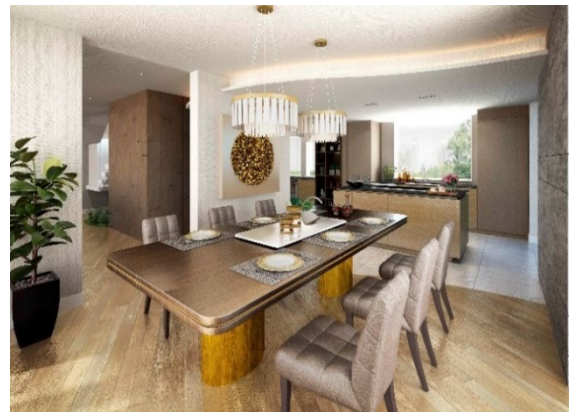
ダイニング・キッチン