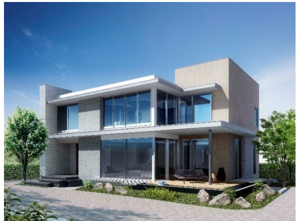
千里ホームギャラリー 外観