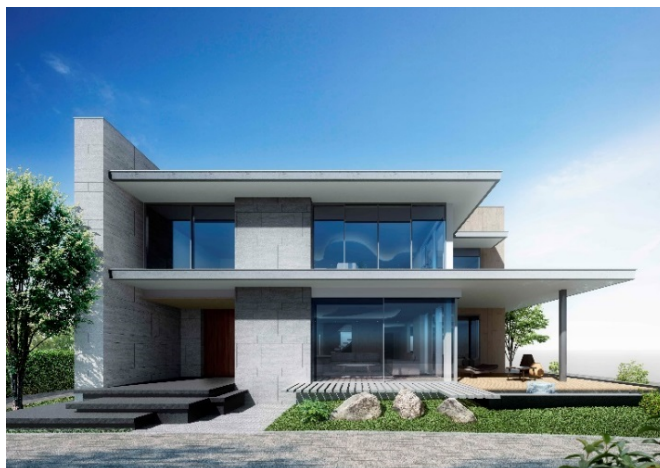
千里ホームギャラリー 外観

三菱地所ホームは今後も、高い顧客ニーズに高品質・高付加価値な提案でお応えする住まいづくりに努めてまいります。