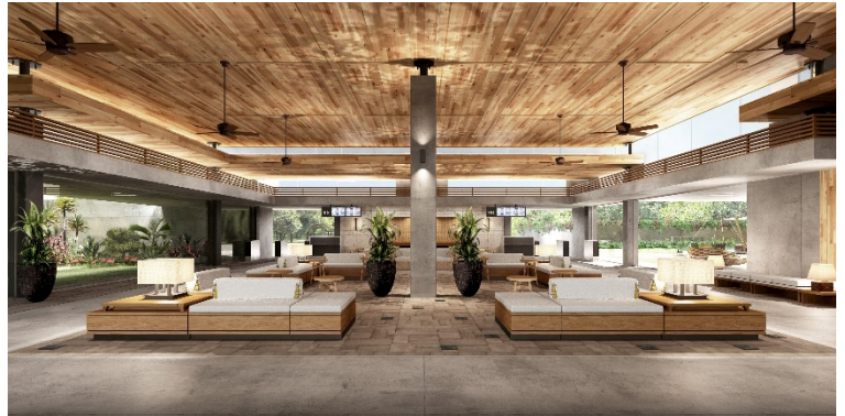
下地島空港旅客ターミナル施設イメージ