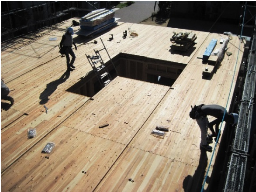
千里ホームギャラリー 施工写真