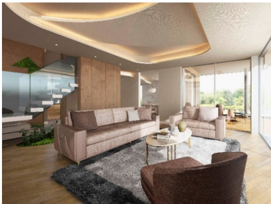
グランドラウンジ