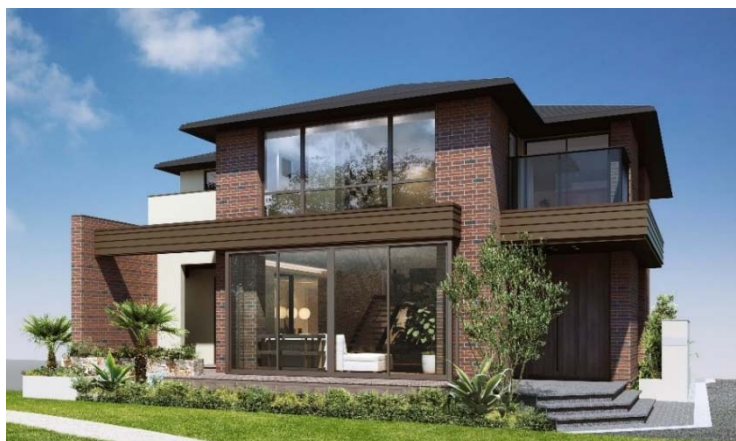
『ONE ORDER』平沼橋第1ホームギャラリー 外観

三菱地所ホームは今後も、お客様の多様なニーズと価値観に高品質と魅力ある提案でお応えする住まいづくりに努めてまいります。