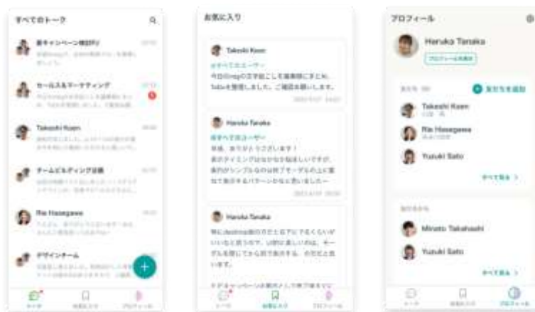
▲基本操作画面（トーク一覧／お気に入り／プロフィール）