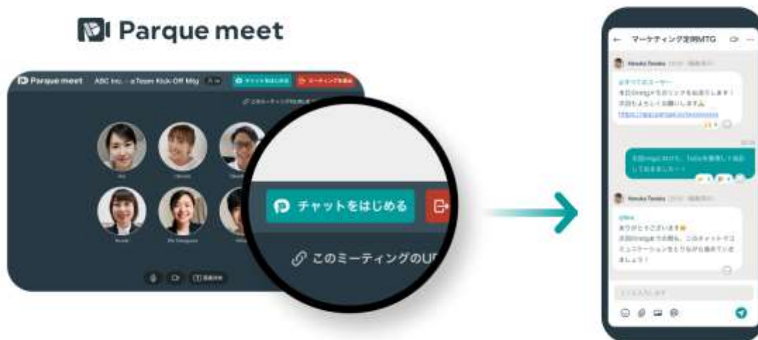
▲Parquetalkで発行した URL からParquetalkが開始できる

これにより、ウェブ会議のあと、堅苦しいメールでのやりとりを行うことなく、チャットによる気軽なコミュニケーションを開始することができます。