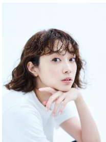
清水 くるみ（しみず くるみ）

1994年7月16日生まれ、愛知県出身。アミューズ所属。 主な出演作品は、ドラマ『親友は悪女』、NHK連続テレビ小説『ブギウギ』、ミュージカル『ミセン』、舞台『東京輪舞』など。 4月27日からはミュージカル『キンキーブーツ』に出演予定。