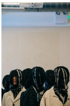
KIKO KOSTADINOV 19/20AW