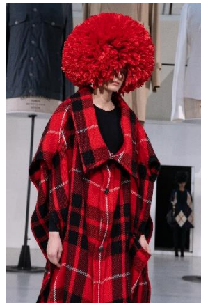
ANREALAGE 2019-20 A/W Collection