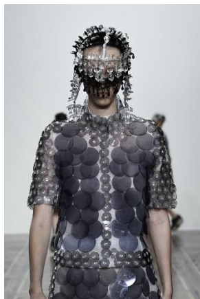
ANREALAGE 2019 S/S Collection