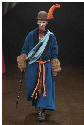
UNDERCOVER 19/20AW Mens Collection