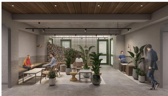
▲2F ラウンジイメージ

また、奥渋谷という立地を活かして、近隣の飲食店や代々木公園をサードプレイスとして、リフレッシュしながら日々のワークライフを送ることができます。