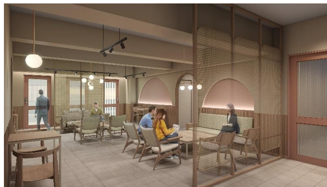
▲3F ラウンジイメージ

本日より4F区画の先行募集を開始します。その他のフロアでは、約24㎡～71㎡の区画を企画予定です。8月中旬より先行内覧を行い、9月上旬より入居が可能となっております。