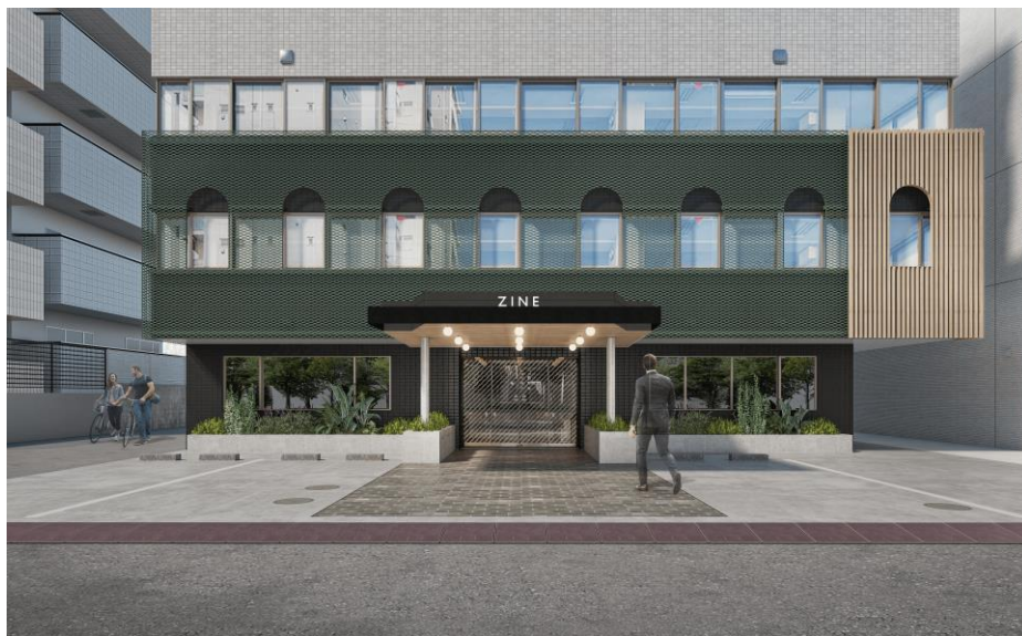
▲ZINE YOYOGI-KOEN 外観完成イメージ

ハチ公像がシンボルマークのハチ公ソース株式会社所有のビル1Fから4Fをリアルゲイトがマスターリースし、クリエイティブワーカー向けオフィスへとリノベーションします。