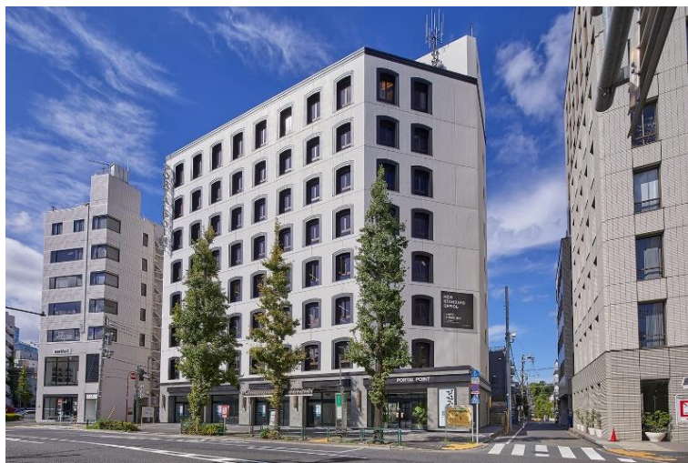
▲PORTAL POINT HARAJUKU 外観